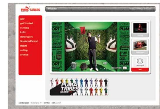
プーマジャパン株式会社