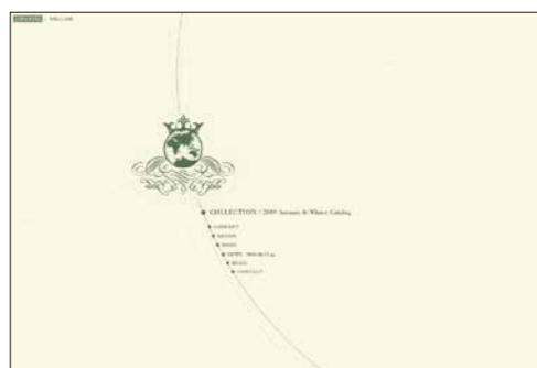
株式会社 SHIPS / Le globe