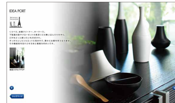
株式会社 イデアポート